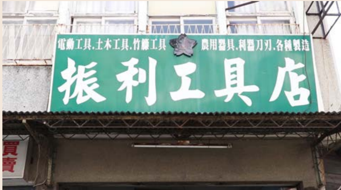
▲位於台南市中西區的沒落老技藝— 振利工具店