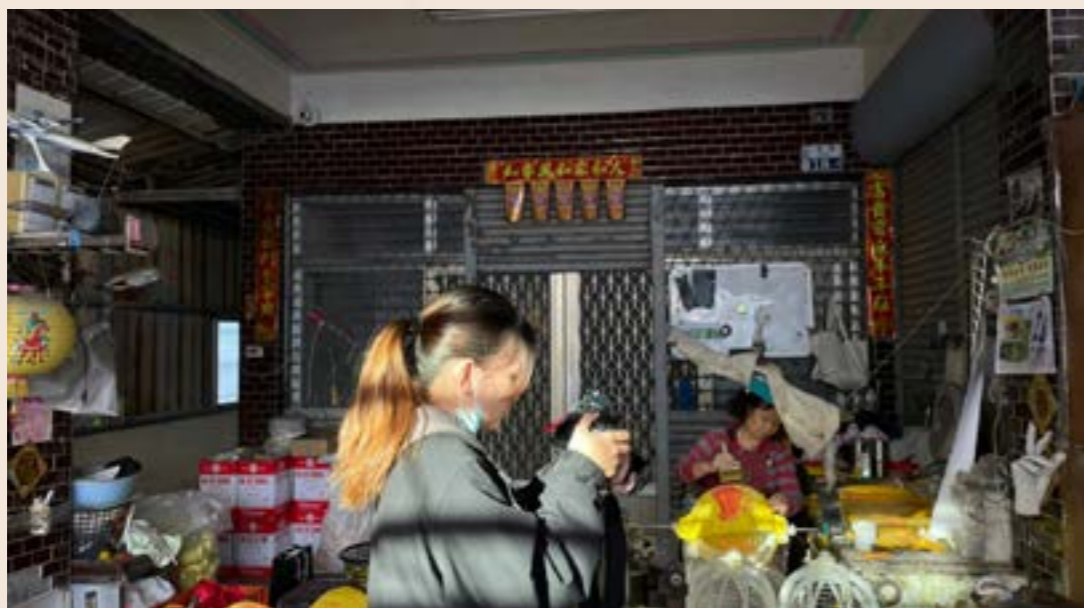
▲ 記者洗旻暄拍攝採訪燈籠手工藝過程