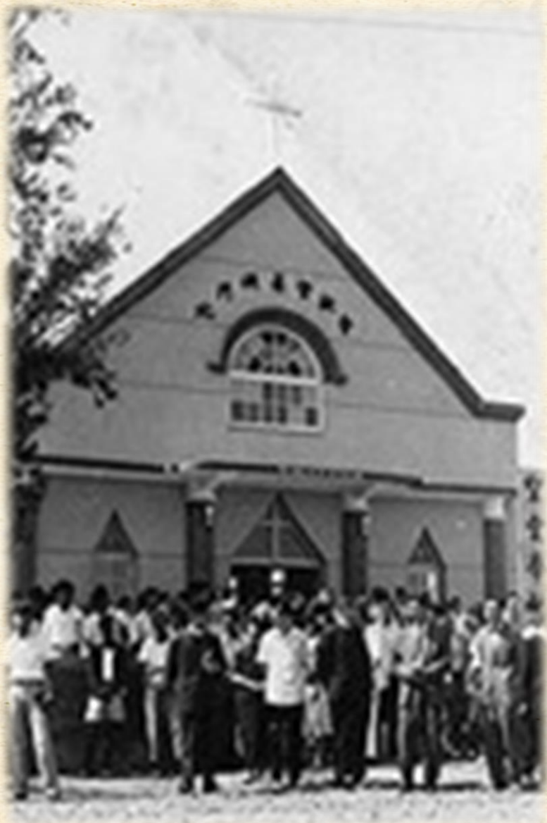
北門嶼教會落成獻堂儀式(1962年)