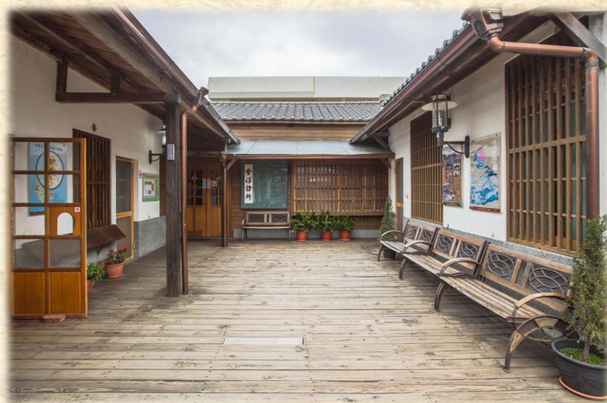
位於台南北門的烏腳病博物館

館內目前所藏即都是與烏腳病醫療有關的器材、心情、以及故事；其中有許多以防腐劑泡存的烏腳病患者殘肢，見證受難者的苦難歲月。