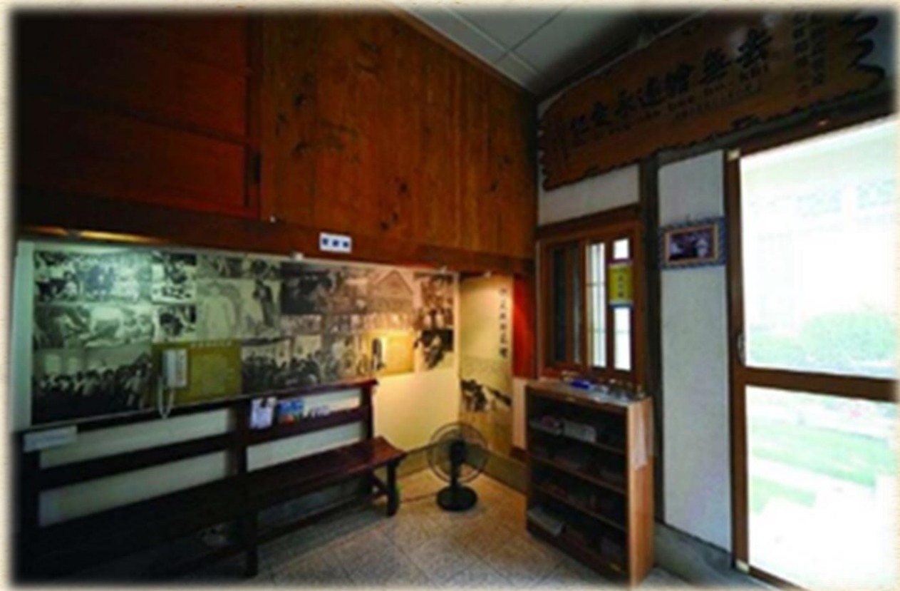
台灣烏腳病醫療紀念館內部